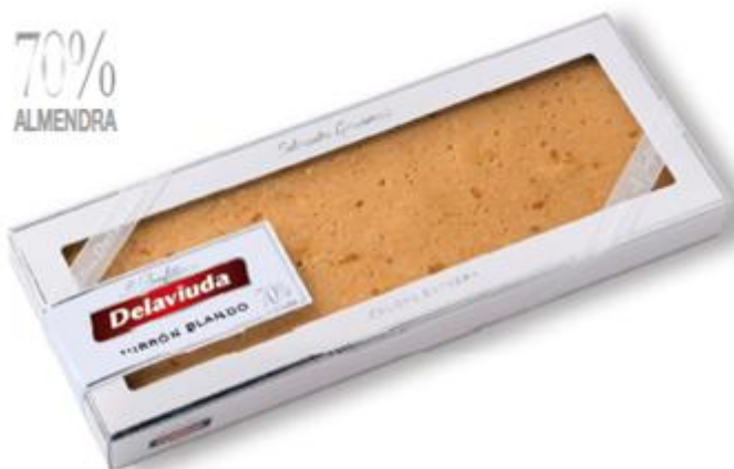
Turrón Blando 70% Almendra