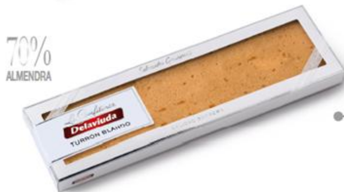
Turrón Blando 70% Almendra